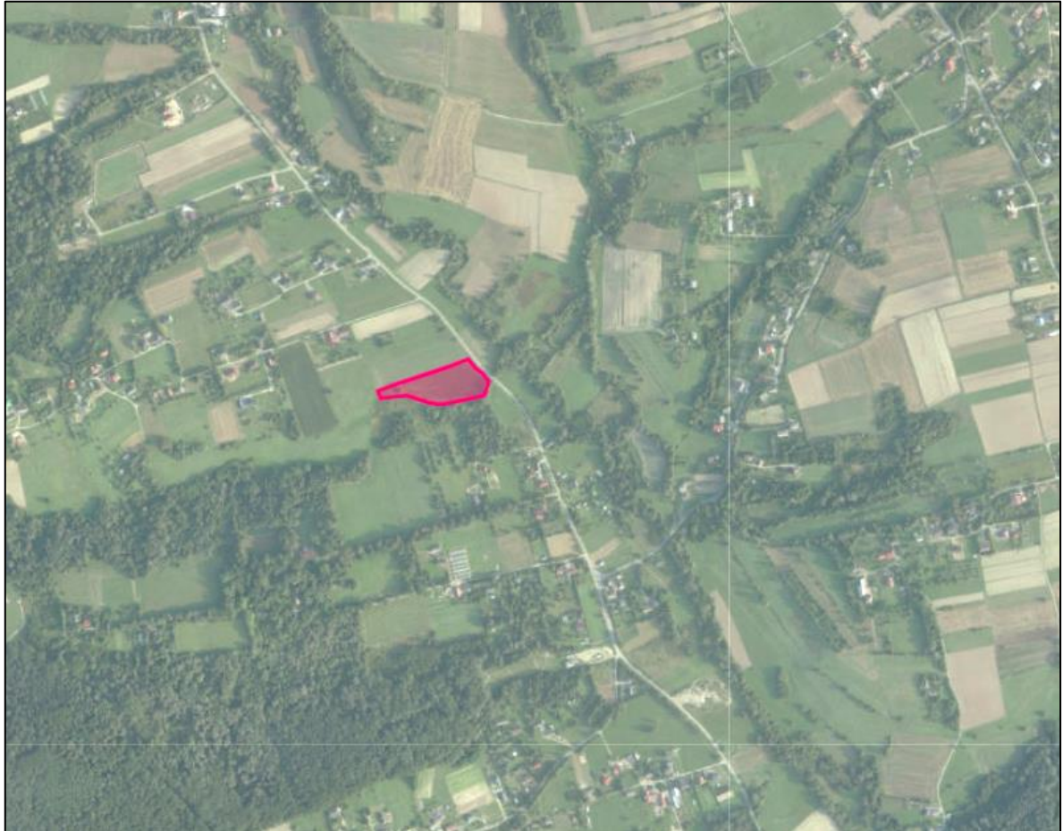
Rys.1. Ortofotomapa z lokalizacją przedmiotowej nieruchomości.