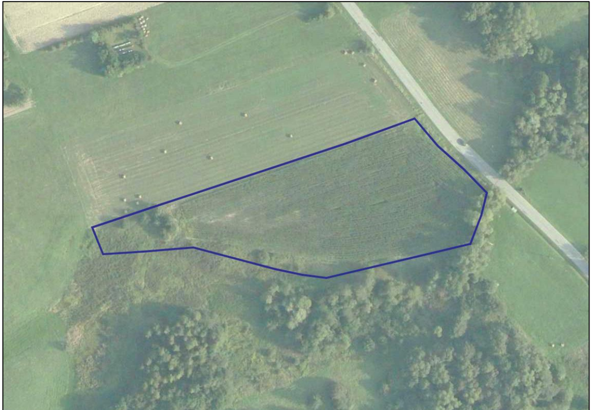
Rys.3. Ortofotomapa z widokiem na działkę nr 60