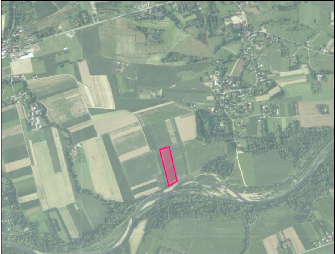
Rys.1. Ortofotomapa z lokalizacją przedmiotowej nieruchomości.