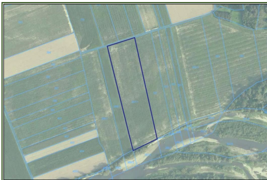
Rys.3. Ortofotomapa z widokiem na działkę nr 387/1